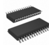
MCP23017-E/SO Micrel / Microchip Technology IC I/O EXPANDER I2C 16B 28SOIC