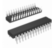
MCP23017-E/SP Micrel / Microchip Technology IC I/O EXPANDER I2C 16B 28SDIP