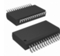
MCP23017-E/SS Micrel / Microchip Technology IC I/O EXPANDER I2C 16B 28SSOP