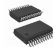
PCA9675DB,112 NXP Semiconductors / Freescale IC I/O EXPANDER I2C 16B 24SSOP