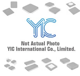
PCA9675DB PHILIS PCA9675DB PHILIS