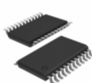
PCA9675PW,112 NXP Semiconductors / Freescale IC I/O EXPANDER I2C 16B 24TSSOP