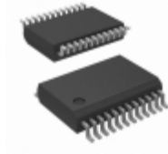
PCA9675DB,118 NXP Semiconductors / Freescale IC I/O EXPANDER I2C 16B 24SSOP